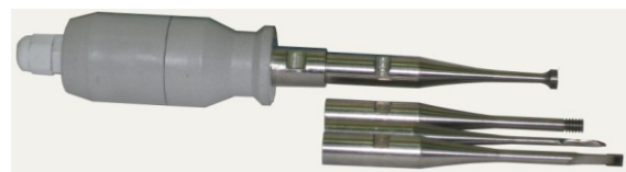
Рис. 2. УЗКС и набор инструментов для работы в составе разрабатываемого генератора

На начальном этапе проектирования электронного генератора было принято использовать ультразвуковую колебательную систему, встроенную в пластиковую рукоятку и предназначенную для удерживания системы в руке, с четырьмя сменными рабочими инструментами. Два рабочих инструмента предназначены для обработки жидких сред, два других представлены в виде небольшого ножика и стамески (см. Рис 2). Предельная максимальная мощность ультразвукового аппарата была рассчитана из условия возникновения в жидких средах режима развитой кавитации, что составило 120 Вт.