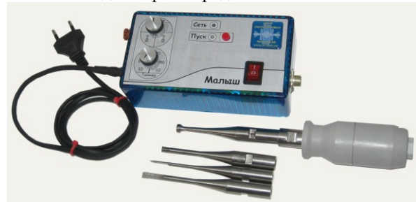
Рис.5. Ультразвуковой аппарат «Мальш»

В результате проделанной работы, был разработан малогабаритный многофункциональный ультразвуковой технологический аппарат, ориентированный на индивидуального потребителя, внешний вид которого представлен на Рис. 5.