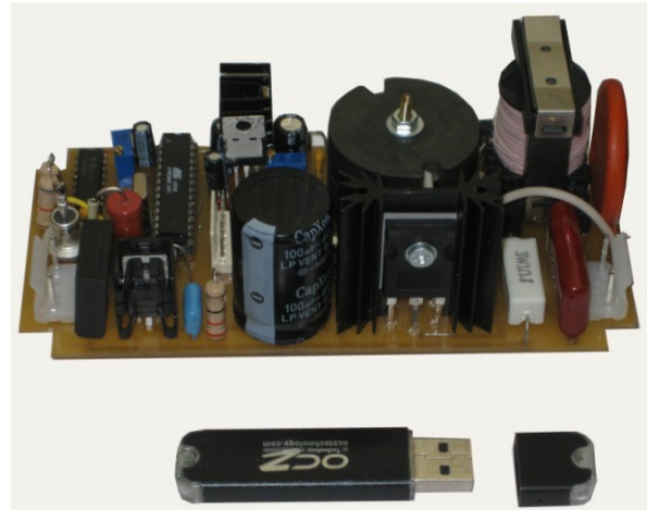
Рис.4. Электронная «начинка» ультразвукового аппарата

В конечном итоге была разработана и изготовлена электрическая часть ультразвукового генератора, внешний вид которой представлен на Рис. 4.